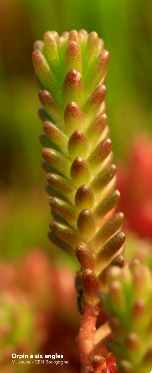
Orpin à six angles

contact@cen-bourgogne.fr www.cen-bourgogne.fr