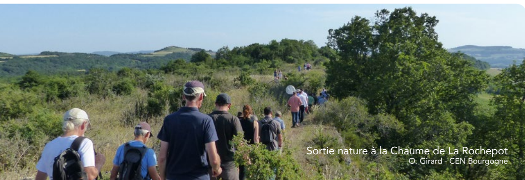
Sortie nature à la Chaume de La Rochepot O. Girard - CEN Bourgogne