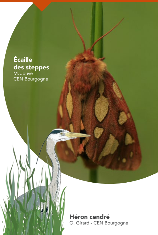
Écaille des steppes M. Jouve CEN Bourgogne