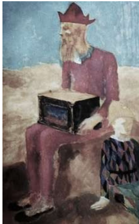
Picasso : Le Joueur d'orgue de Barbarie