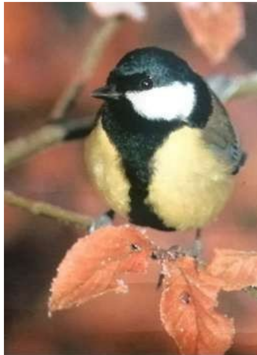
les oiseaux du Morvan (gros plan)