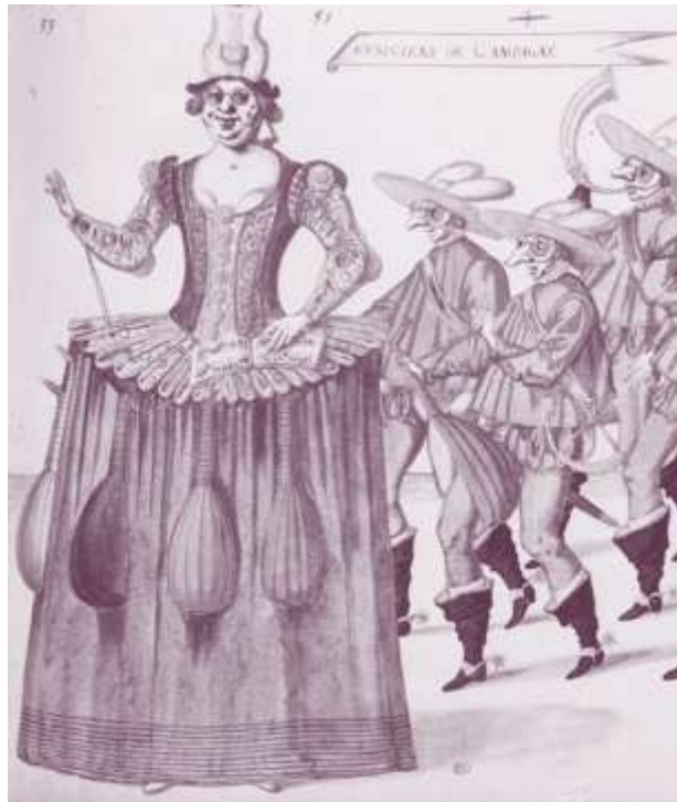
Ballet Les Fées de la forêt

Ces deux ateliers sont indépendants et complémentaires, possibilité de suivre les deux. Sophie évoque lors de ces ateliers le lien entre la danse et la littérature.