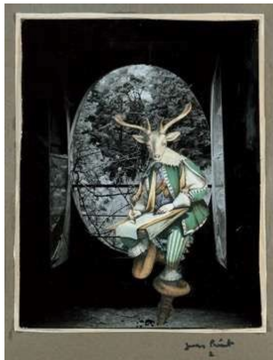
Le désert de Retz

⇒ Chacun repart avec son collage-poétique et le goût du surréalisme