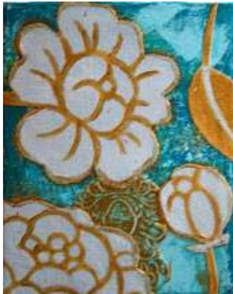
Acrylique et collages 2011 – © Emmanuelle THOMAS-PAOLI